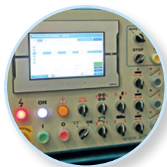
Panneau de configuration CMC