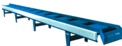
Mod. LT motorizada