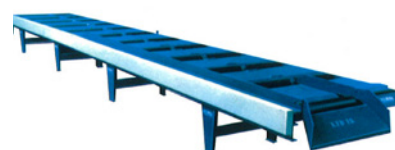
Mod. LTD motorizada